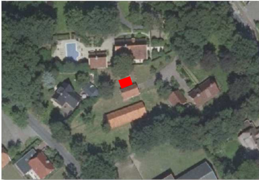
Locatie van het te bouwen bijgebouw, deze wordt met het rode vlak aangeduid.

Het concrete voornemen bestaat om een klein bijgebouw op te richten in het plangebied. Het bijgebouw wordt tegen een bestaand gebouw gebouwd. Op onderstaande luchtfoto wordt de locatie van het te bouwen bijgebouw aangeduid met het rode vlak.