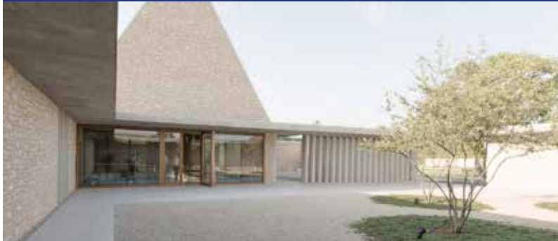
zachte overgang binnen-buiten