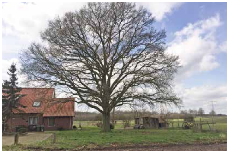
bestaande karakteristieke eik