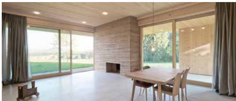
rustig en natuurlijk materiaalgebruik