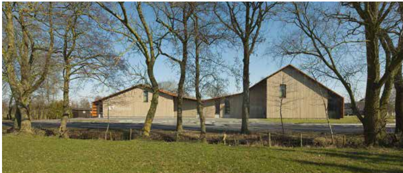
ensemble passend in het landschap