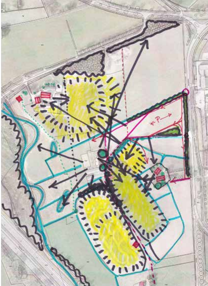
situatieschets 17-06-2015