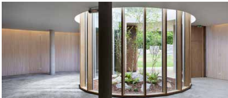
relatie binnen en buiten