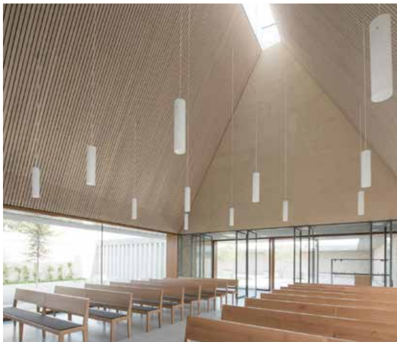
ingetogen en sober interieur