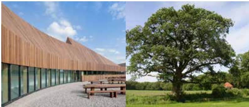
besloten erf als binnenplaats rondom de bestaande eik