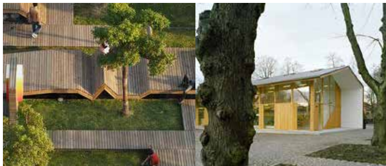
natuurlijke landschappelijke inpassing