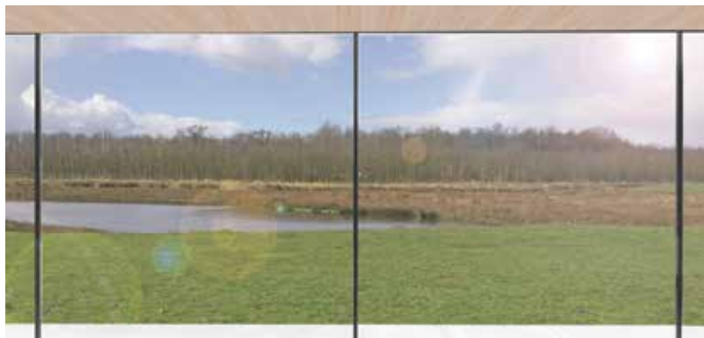
uitzicht op het landschap