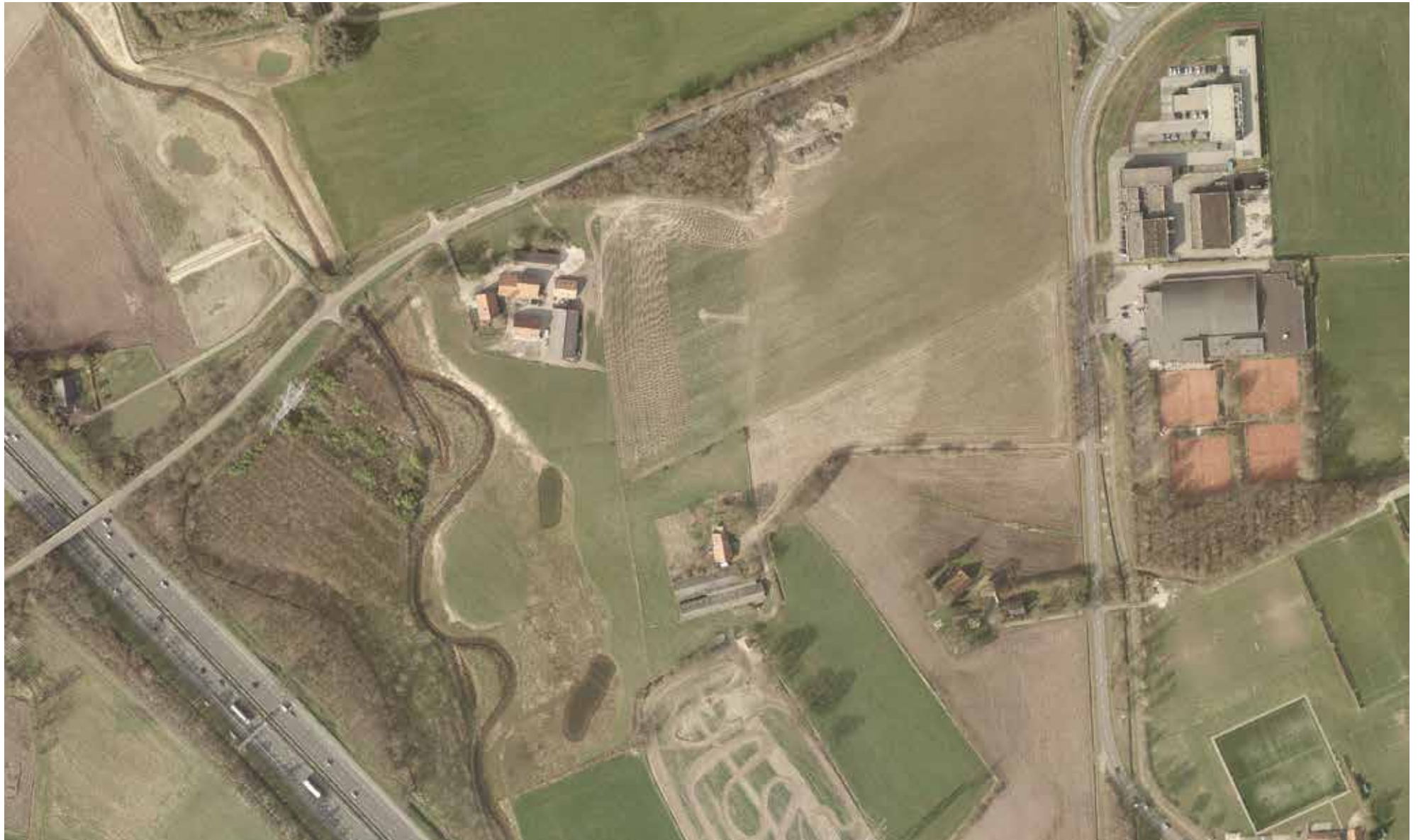
situatie rond 2015