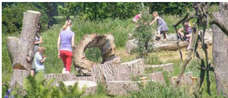
diverse plekken voor volwassenen en kinderen