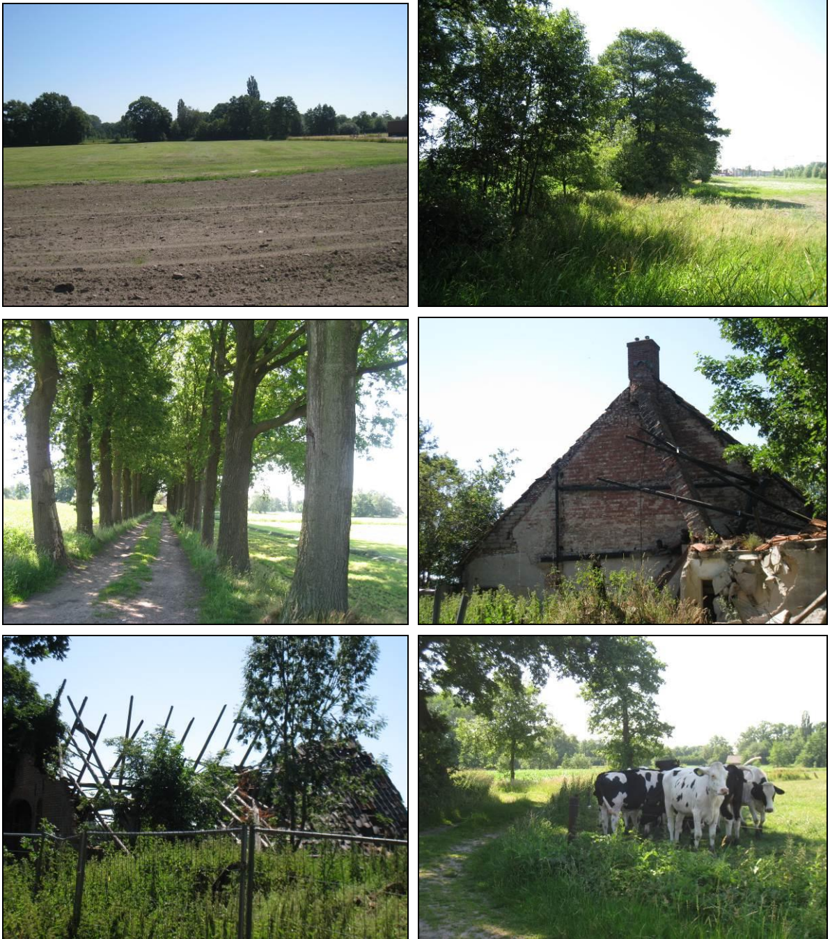
Figuur 2. Aanzicht van het plangebied van Boswonen te Borne.