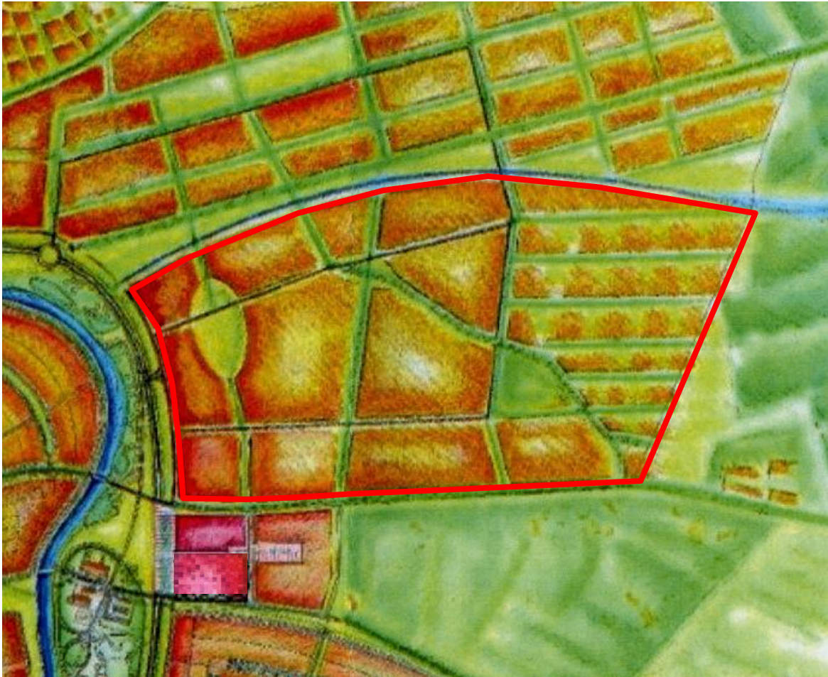
Figuur 3. Impressie van de plannen van Boswonen te Borne.